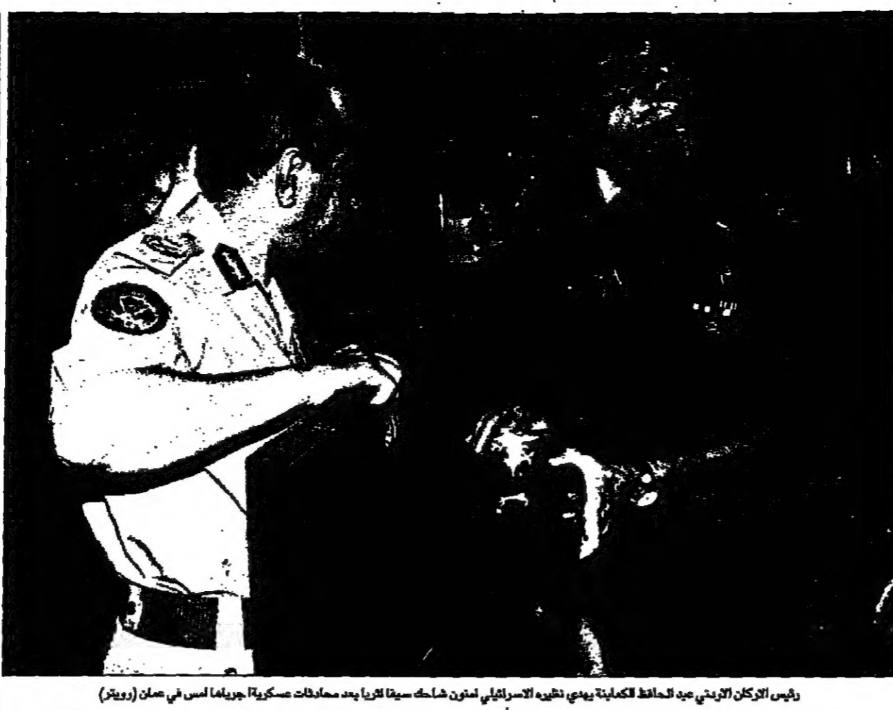
رئيس الركن الجوي عبد الحافظ كنعاني يدير نظيره الإسرائيلي أمين شاكس سبعا لثريا بعد محادثات عسكرية جريماً لاس في سان

واشنطن - «القدس العربي» - من محمد لبحج: أكد المواطن السويدي لبحج، الذي يعيش في السويد، ان الارهابيين هم الذين قصفوا العراق دعماً لـ«الديمقراطية». وقال لبحج: «الارهابيون هم الذين قصفوا العراق دعماً لـ«الديمقراطية»».